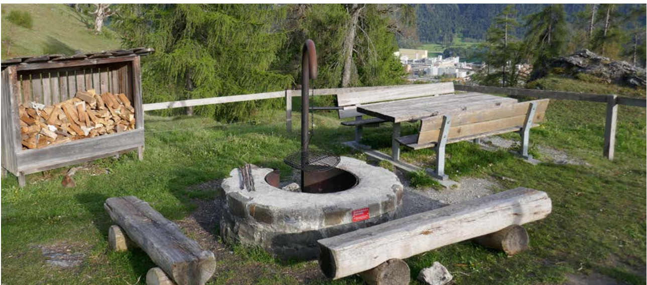
Feuerstelle mit Stein- und Metallring