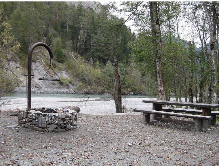
Feuerstelle auf natürlichem Kiesboden in Flussnähe.