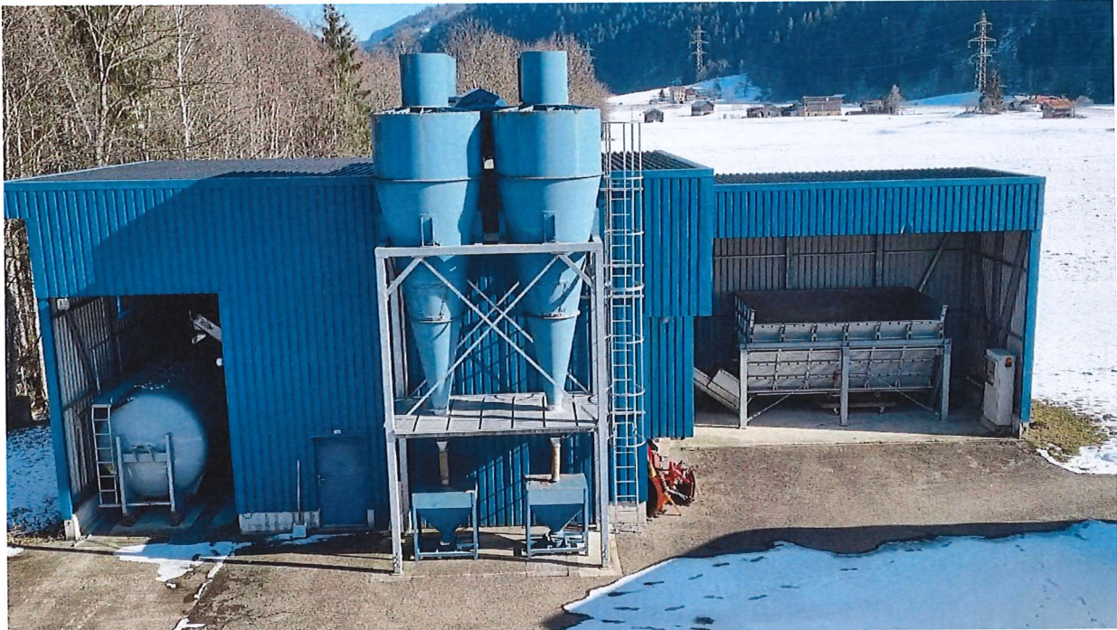
baghetg cun schigentera ad aria freida, seniester silo da transport dil gliet ella fabrica da cement

In grop schazetg muossa cuosts per la dismessa dil gliet cun lavar l'aria sortenta da sur 300 francs per tonna gliet pressegiau. Schebein in tal indrez funcziunass tiels indrezs dalla CSSC cun igl effect giavischau, sa vegnir giudicau endretg p r cu igl indrez ei construius. Eventualas remeduras sco gia experimentau avon onns extendidamein tier la schigentera ad aria freida savessan lu caschunar cuosts aunc pli aults.