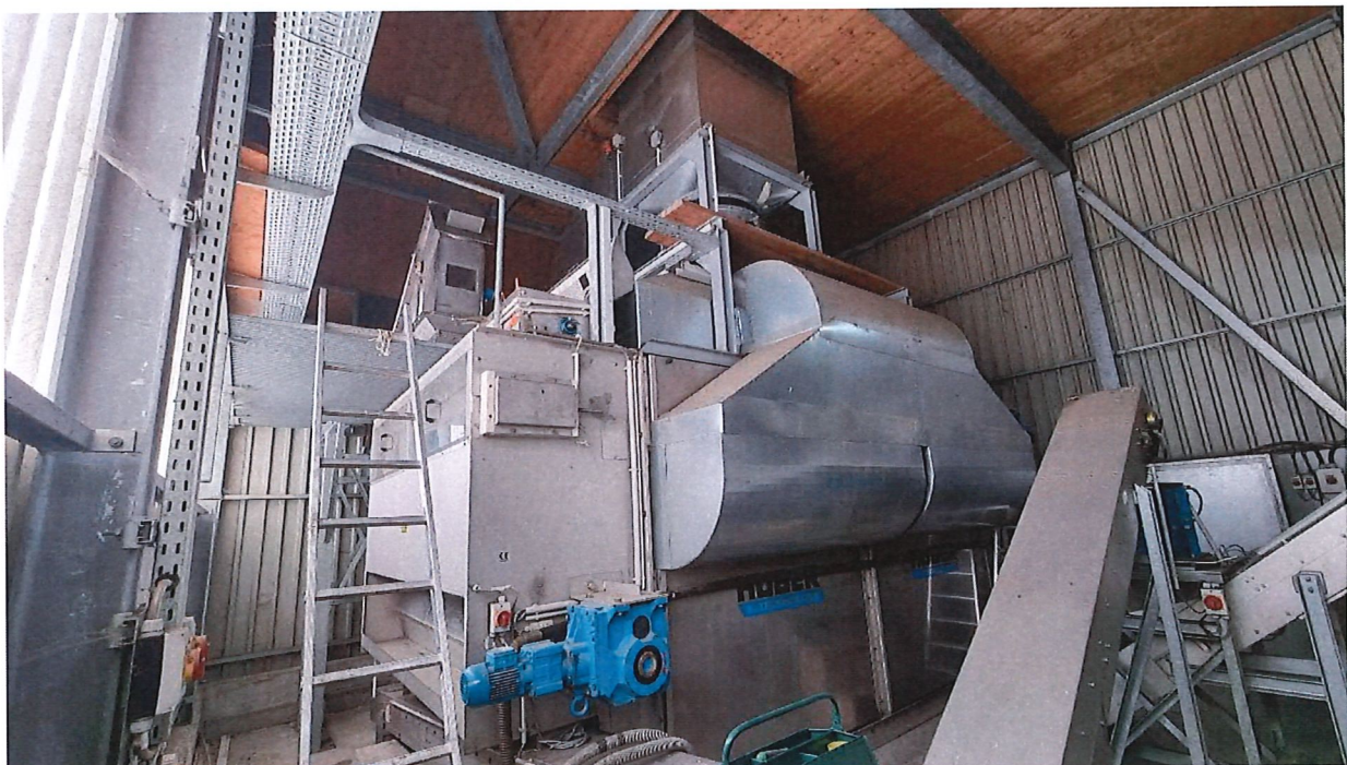
schigentera ad aria freida