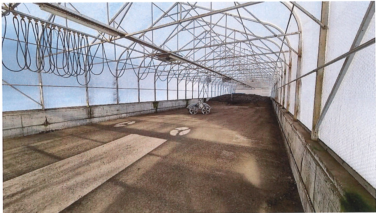
halla solara endadens, davostier gliet aunc buca schigentaus